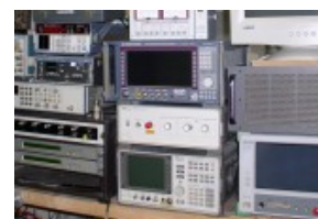
Sent RF beschikt over voldoende middelen voor EMC Troubleshooting